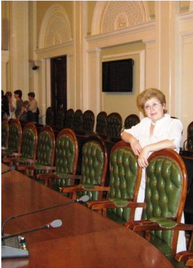
Екскурсія до Верховної Ради України. м. Київ, червень 2009 р.